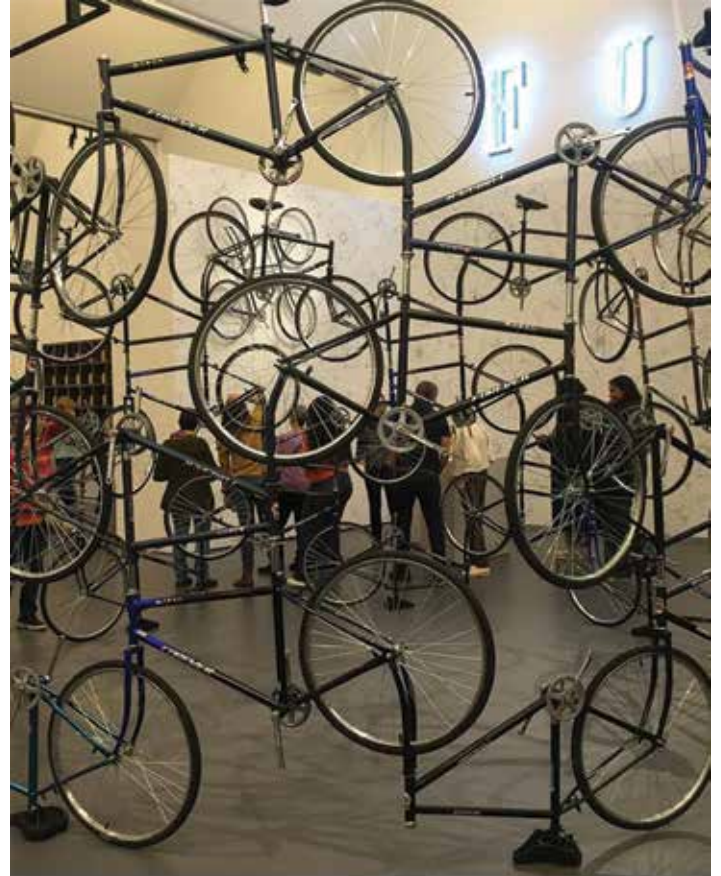
Fietsen van Ai Weiwei, gezien in het Kunsthall in Rotterdam.

Even een déjà vu. In de dertiger jaren van de vorige eeuw stonden de kranten bol van ingezonden brieven over het opkomen van de fascisme en de houding tegenover de Joden. Aan de ene kant werd Hitler verheerlijkt als een door God gezonden redder die