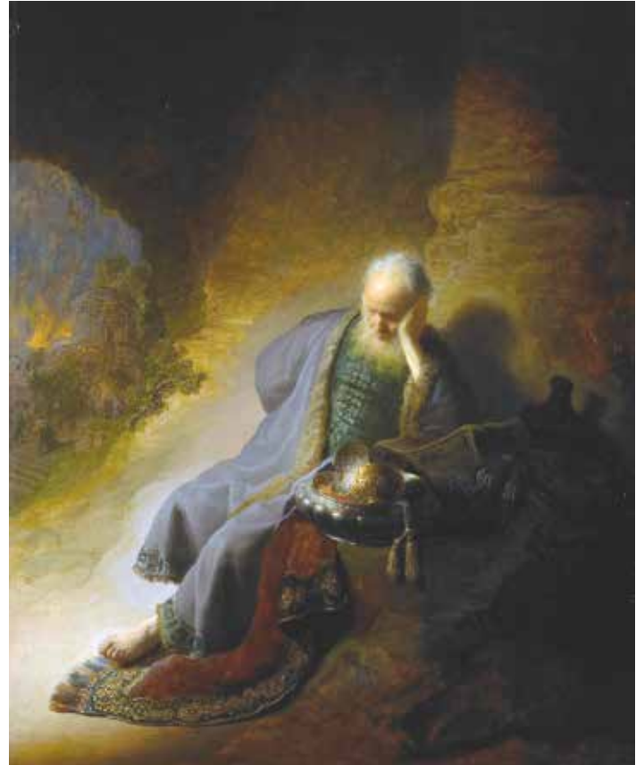
Rembrandt: Jeremia treurend over de verwoesting van Jeruzalem.

Jeremia leefde dus in een rottijsd, in een bange tijd, in een tijd dat een groot deel van zijn volksgenoten gevangen werd genomen, uit Jeruzalem werd gedeporteerd en verplaatst naar een plek ver weg in Babel. Er is sprake van etnische zuivering. Het is een oorlogssituatie, misschien wel vergelijkbaar met wat de Palestijnen in Gaza overkomt. Een groot deel van de bevolking weggejaagd